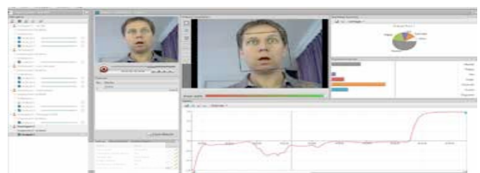
Figure 4 : reconnaissance des expressions du visage/ Facial expression recognition