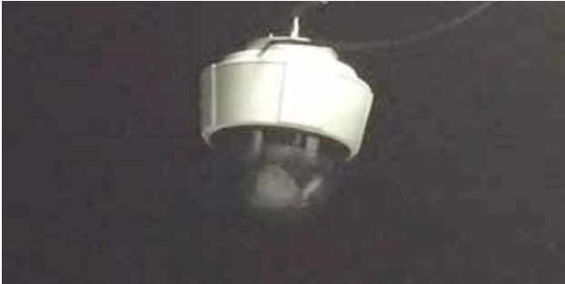
Figure 1 : Caméra. Camera.

This equipment allows capturing and analysing the behaviour of people in interaction.