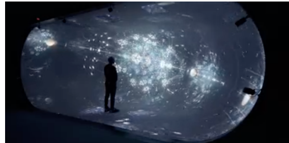
Figure 1 : Aperçu de l'intérieur de l'écran/View of the screen

With its double-curved screen, TORE is an innovative immersive device for exploring virtual environments and collaboration. It enables interaction, via motion capture, with virtual agents and avatars. A dynamic stereoscopic image is projected using 20 high-resolution projectors.